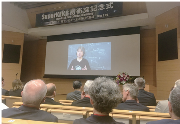
6月26日：高エネルギー加速器研究機構 (KEK) の SuperKEKB 初衝突記念式で祝辞 (ビデオメッセージ)。