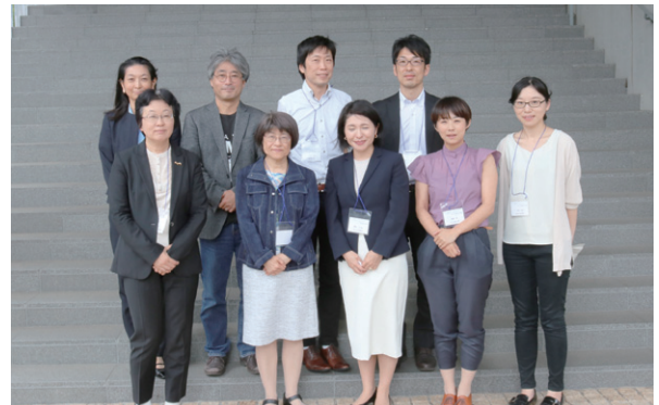
6月17日：Kavli IPMUで行われたJST-RISTEX「科学技術イノベーション政策のための科学」横山プロジェクトシンポジウム「数物系女子はなぜ少ないのか」出席。