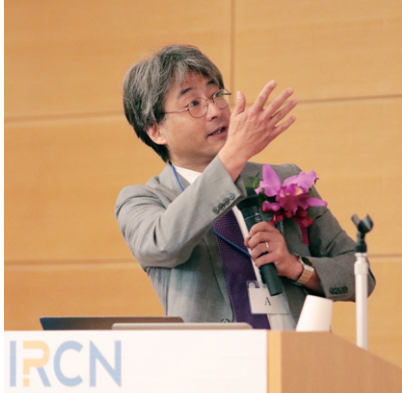
5月28日：東京大学国際高等研究所ニューロインテリジェンス国際研究機構 (IRCN) のオープニングセレモニーで挨拶。